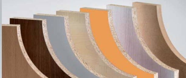
Diamaster PLUS 3 und PRO 3

Echt-Z3: Höhere Produktivität und bessere Qualität beim Fräsen