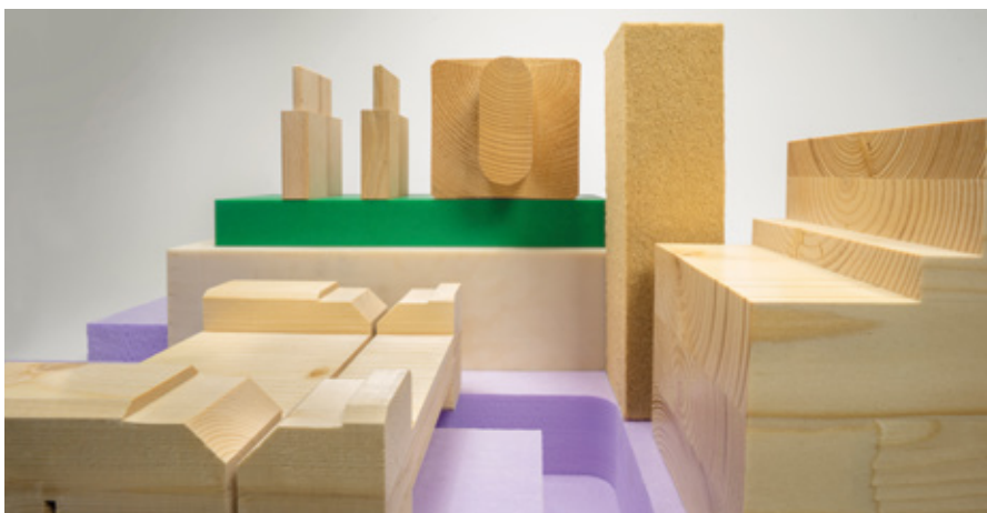
Het HeliCut-systeem maakt indruk met zijn scheurvrije bewerkingsresultaten in verschillende materialen en bewerkingsprocessen.