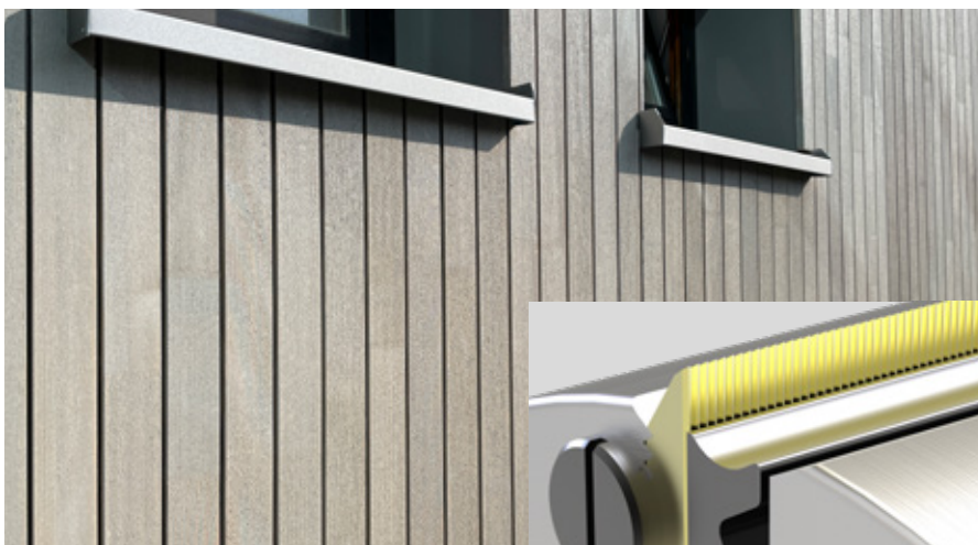
El uso de cuchillas de cepillado de perfiles produce un revestimiento de fachada con un aspecto de sierra tosca.